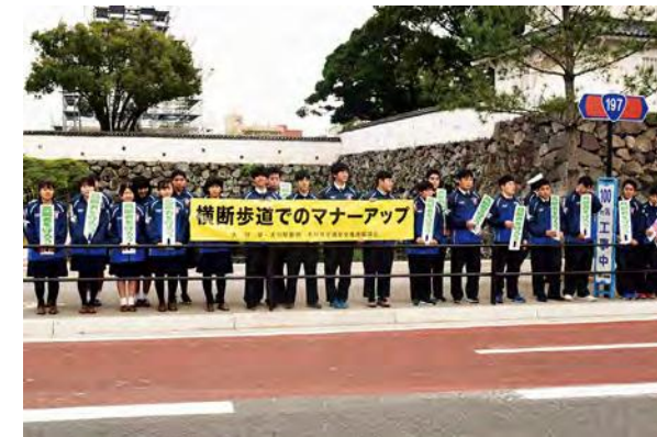
県民等の協働による交通安全活動