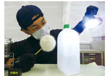
初動捜査における現場鑑識活動