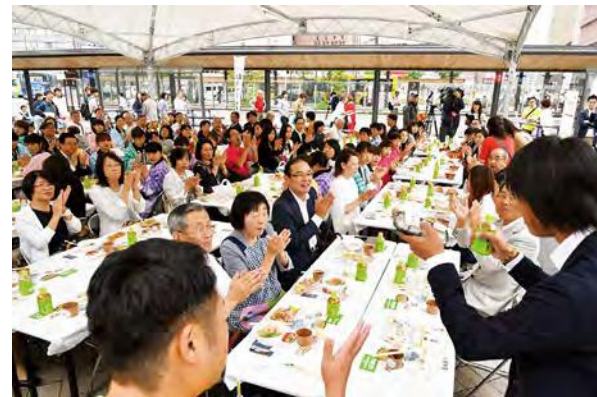
大勢で食卓を囲む「ロングテーブル」(食育推進全国大会)