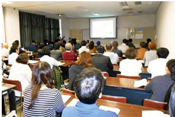
HACCPワークショップ型セミナー