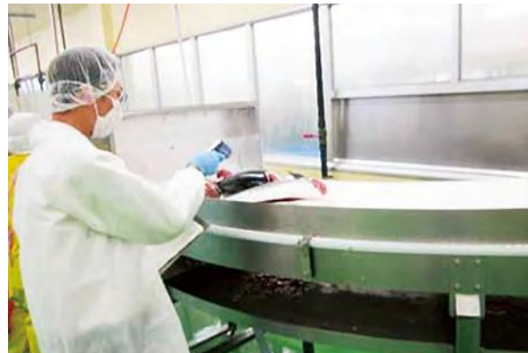
食品衛生の監視・指導