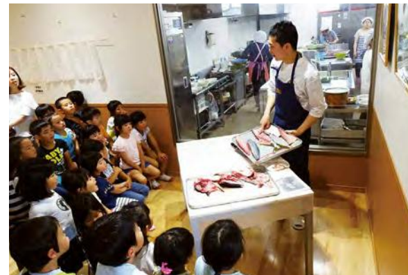
小学校での食育授業