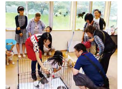
犬・猫の譲渡会(動物愛護センター)