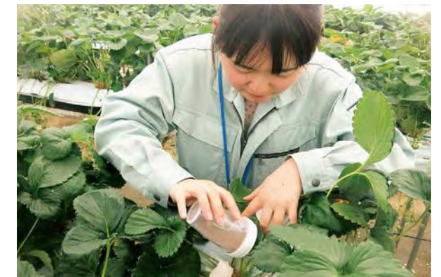
天敵を用いた害虫対策