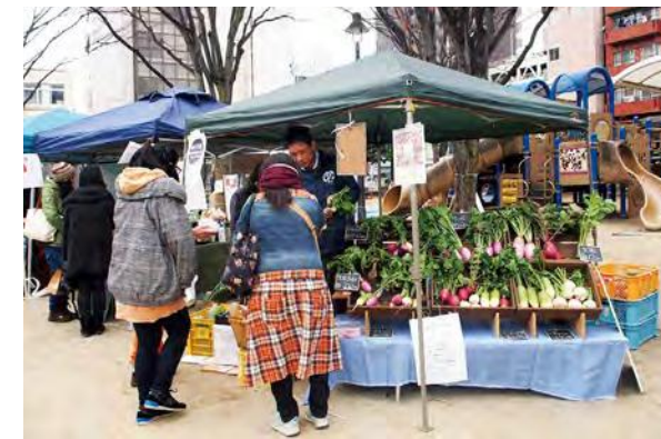
オーガニックフェスタを通じた有機栽培への理解醸成