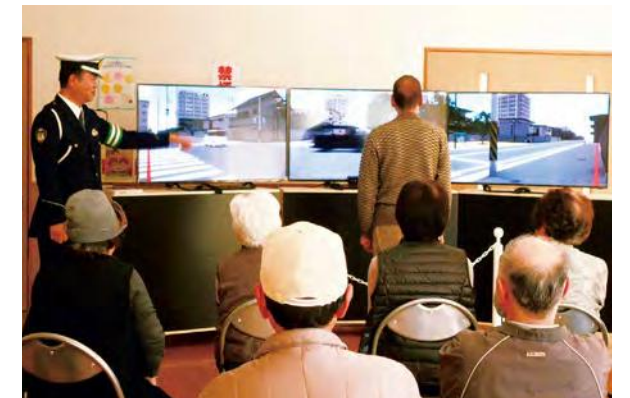
高齢歩行者に対する参加・体験型講習