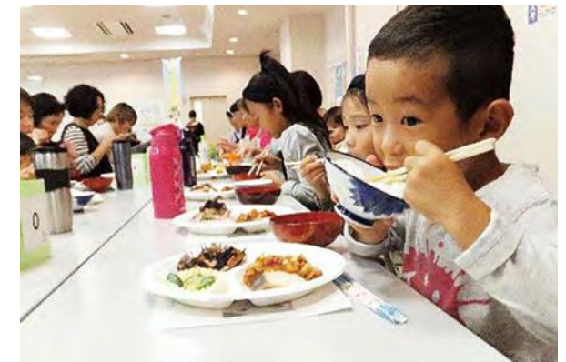
地域コミュニティを活用した共食