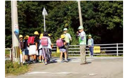
自主防犯パトロール隊との協働による児童の見守り活動