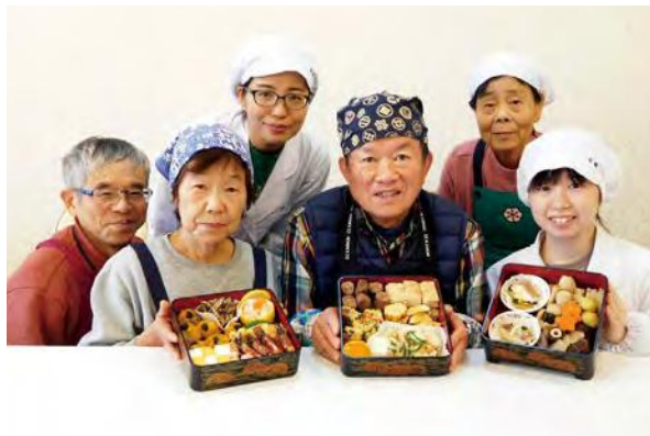
伝統的な食文化の伝承