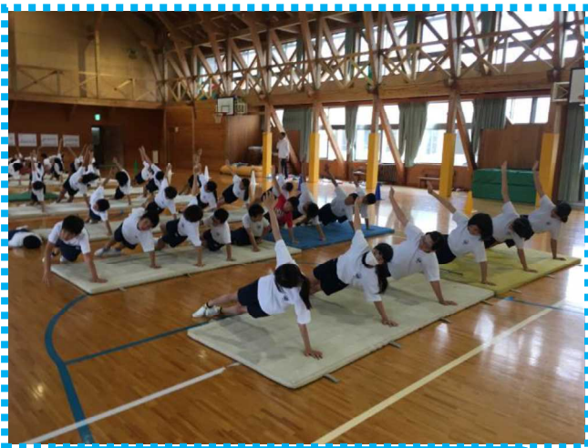
6月マット週間、組み体操につながる一斉のT字バランス