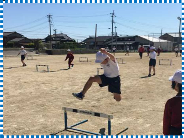
5月の陸上運動月間、ハードル走 運動場にハードルを40台準備する