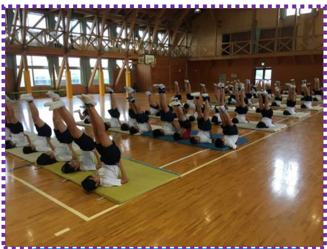
6月マット週間、組み体操につながる一斉の肩支持倒立