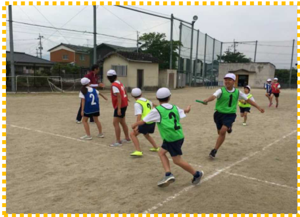
5月陸上月間、学年ごとのリレー大会