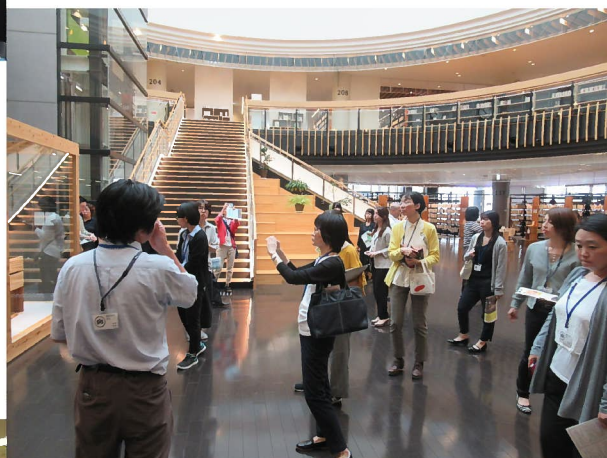
【公立図書館等職員研修会の様子】