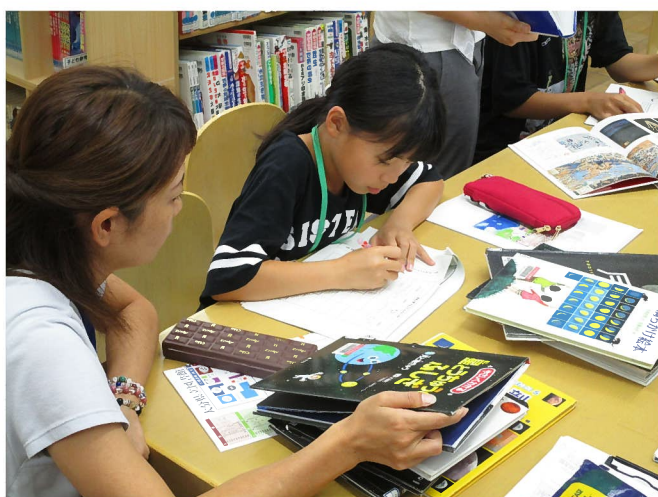
【夏休み調べ学習講座の様子】