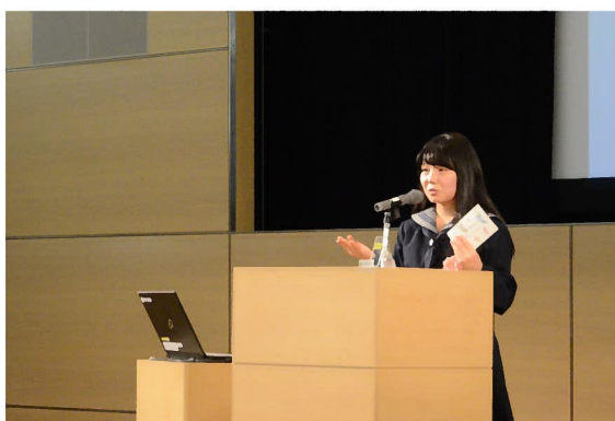
【中学校・高等学校ビブリオバトル大分県大会の様子】