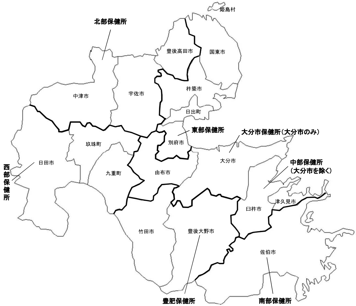
图1 保健所等管轄区域图 (平成20年4月1日～)