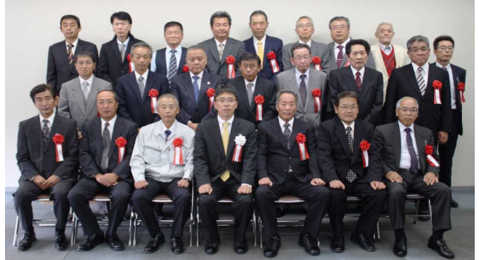
受賞者と神崎商工労働部長（前列中央）の記念写真