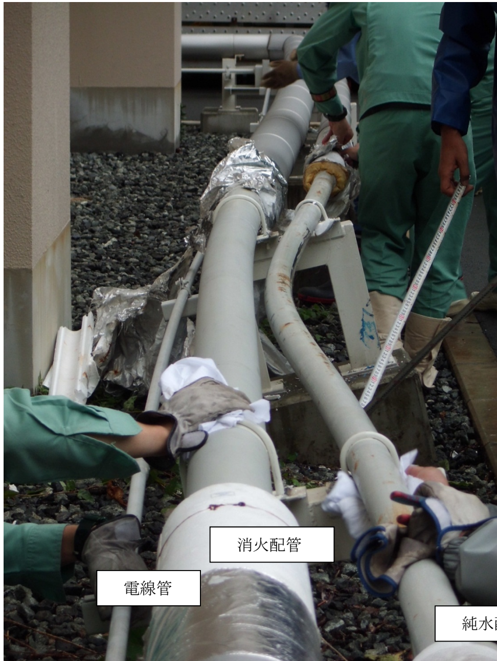
外観確認のため保温材を外した状態