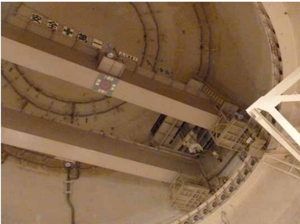
ポークレーン写真