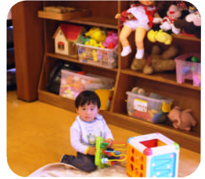
事業内託児所の様子

ばれ、パパ修行中」など、職員のライフスタイルに応じた柔軟な労務管理を導入しているほか、地元の廃校を高齢者を中心とした交流の場「100円居酒屋」として活用するなど、地域コミュニティ活性化にも取り組んでいます。