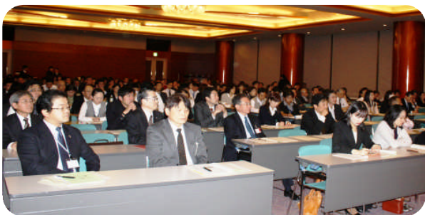
県、大分市などの主催で開催されたセミナー