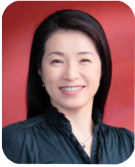
【執筆】 社会保険労務士 二村 織江 (社会保険労務士 事務所アベイク)