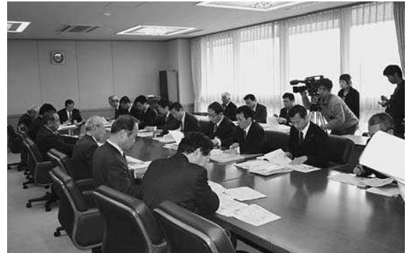
ごみゼロおおいた作戦実施本部

戦略」に位置づけられ、これまで以上に取組を強化していくこととなった。この大分県長期総合計画の環境側面における部門計画として策定された「大分県新環境基本計画—ごみゼロおおいた推進基本プラン—」に基づき、各般の環境施策を着実に推進することによって、『天然自然が輝く 恵み豊かで美しく快適なおおいた』の実現を目指している。