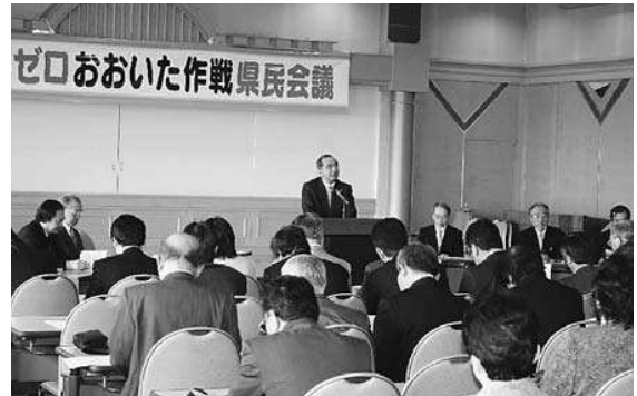
ごみゼロおおいた作戦県民会議

ごみゼロおおいた作戦は、平成17年10月に策定した大分県長期総合計画「安心・活力・発展プラン2005—ともに築こう大分の未来—」において、分野横断的に集中的・重点的に取り組む8つの重点戦略の一つである「豊かな天然自然 磨き輝き