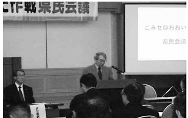
ごみゼロおおいた作戦県民会議

ごみゼロおおいた作戦は、平成17年10月に策定した大分県長期総合計画「安心・活力・発展プラン2005—ともに築こう大分の未来—」において、分野横断的に集中的・重点的に取り組む8つの重点戦略の一つである「豊かな天然自然 磨き輝き