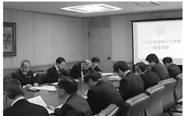
ごみゼロおおいた作戦実施本部

戦略」に位置づけられ、これまで以上に取組を強化していくこととなった。この大分県長期総合計画の環境側面における部門計画として策定された「大分県新環境基本計画—ごみゼロおおいた推進基本プラン—」に基づき、各般の環境施策を着実に推進することによって、『天然自然が輝く 恵み豊かで美しく快適なおおいた』の実現を目指している。また、平成19年9月には、「大分県新環境基本計画」の基本目標に合わせ、「ごみゼロおおいた作戦県民会議」に設置する専門部会8部会を5部会に統合した。（ごみゼロおおいた作戦の概念図は次の図2-1を参照）