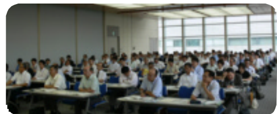
(平成21年度労働講座中央会場)