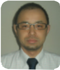
【執筆】 特定社会保険労務士 轟 憲人 (轟社会保険 労務士事務所)