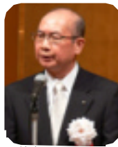
はきはら (羽明理事長)

5月17日、大分市の大分全日空ホテルにおいて開催された記念祝賀会には250名を超える政労使の代表者が出席しました。