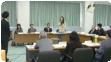
(講師を招いて開講)

受講者は、今後県の派遣アドバイザーとして登録され、企業に対し仕事と子育てを両立し働きやすい職場環境の整備のための啓発や指導等を行います。