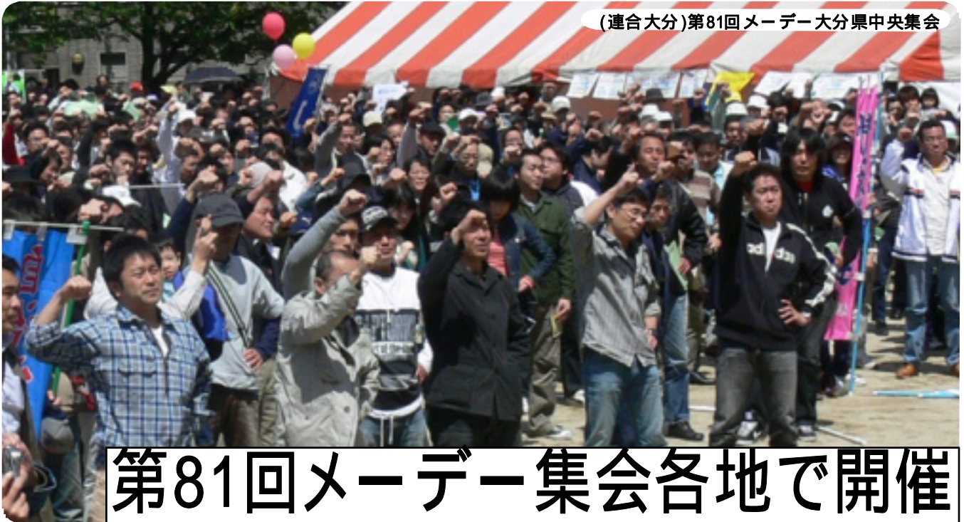
(連合大分)第81回メーデー大分県中央集会