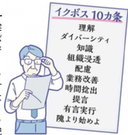
＜イラスト 東京新聞＞

また、同法人が実施している「イクボスプロジェクト」では「イクボス十か条」を作成し、啓発を行っています。この「十か条」の過半を満たしていることが「イクボス」の証だそうです。詳しくは下記HPをご覧ください。