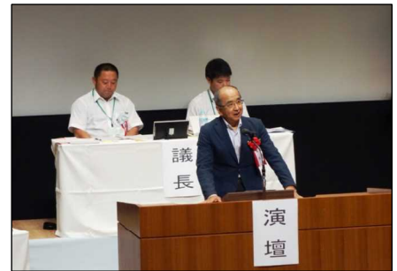
祝辞を述べる広瀬知事

そうした中、今年は大分で本部定時大会が開催されました。広瀬知事も来賓として駆けつけ、祝辞を述べました。2日間にわたった大会では、2017～2018年度の活動方針をはじめとした7議案が承認されました。