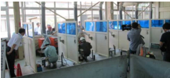
昨年度の大会の様子

日出総合高等学校、大分工業高等学校、情報科学高等学校、津久見高等学校、佐伯豊南高等学校、中津東高等学校、日本文理大学付属高等学校