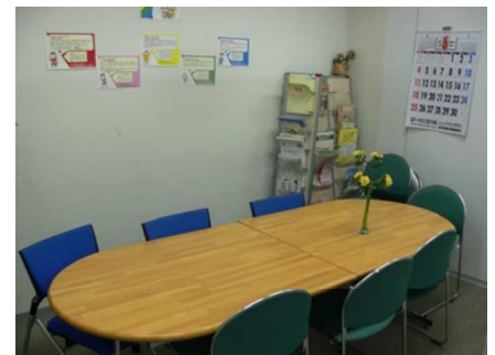
シンプルで落ち着いた雰囲気相談室

そのためにも、企業のトップや事業主、管理職の皆さんが強い意志をもってトップダウンで社内改革を進