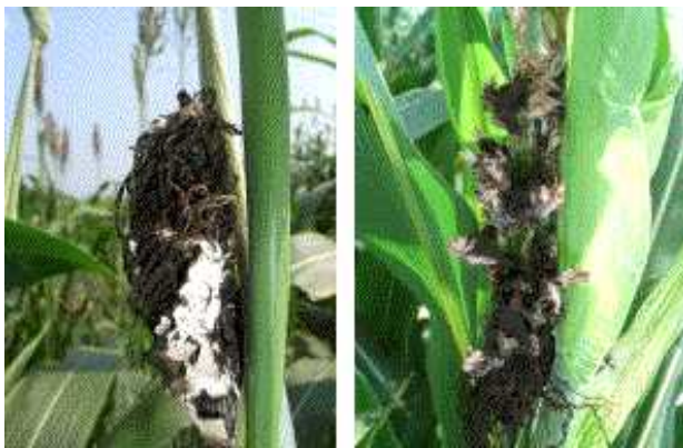
写真1 糸黒穂病の病徴

(注)◎は3年間の検定期間に罹病しなかったもの。○は検定期間が3年に至らなかったが、検定期間中に罹病の無かったもの