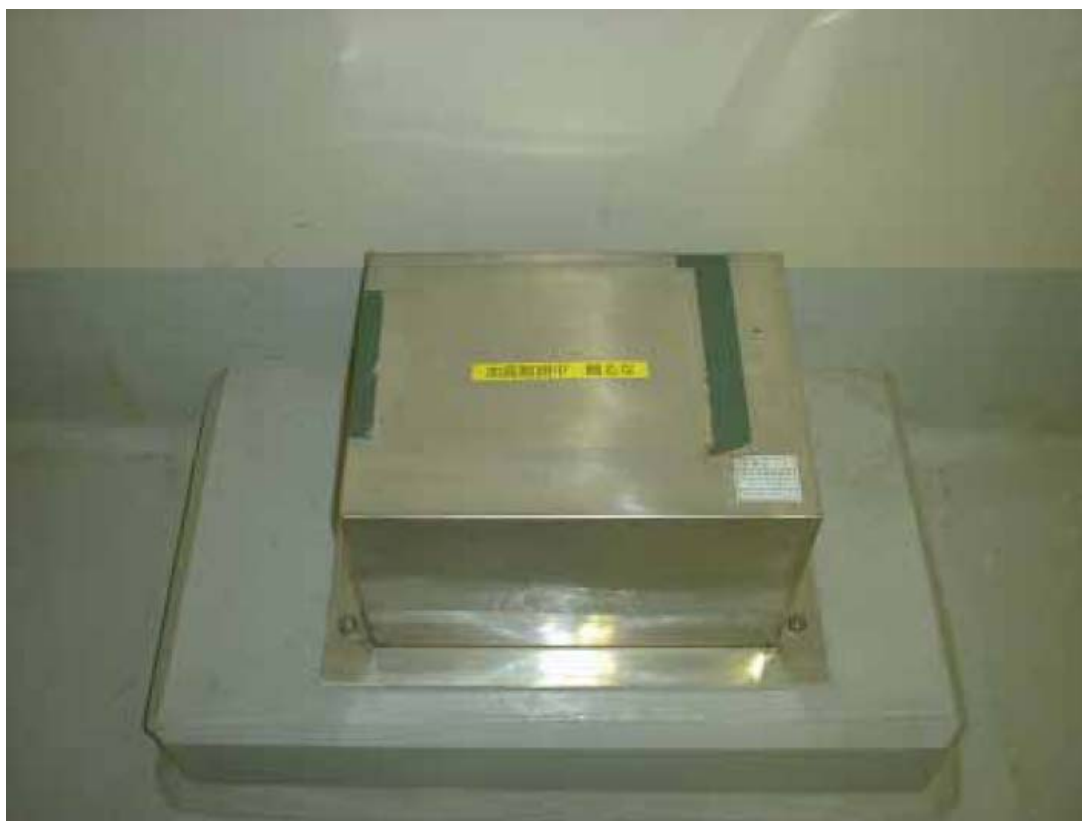
観測用地震計（検出部）