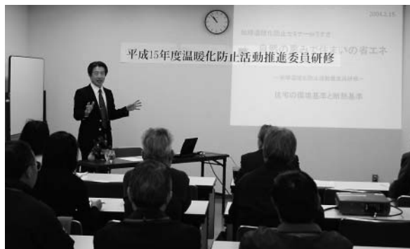
地球温暖化防止啓発セミナー

身近にできる温暖化防止をテーマに平成16年2月8日に大分県立芸術会館文化ホールにおいて平成16年2月15日には臼杵市民会館小ホールにおいて、セミナーを開催した。