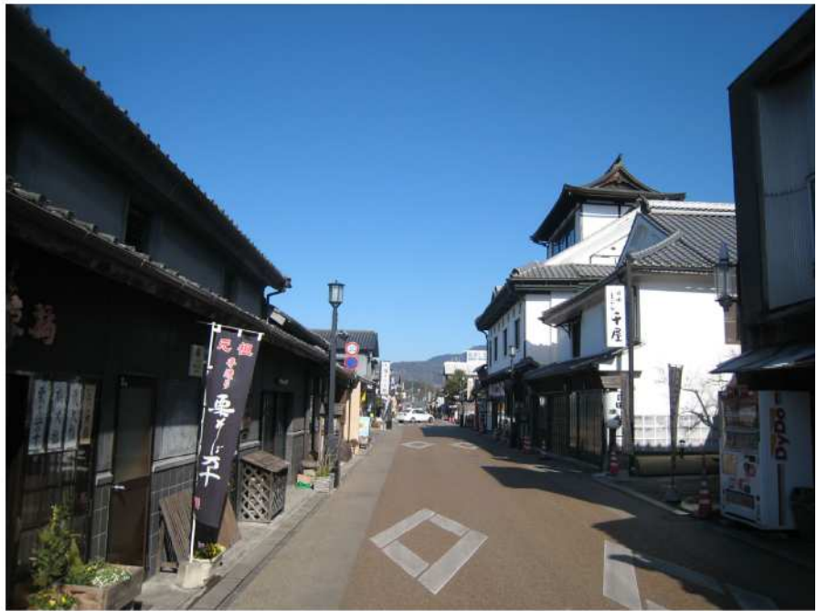
－豆田地区のまちなみ－