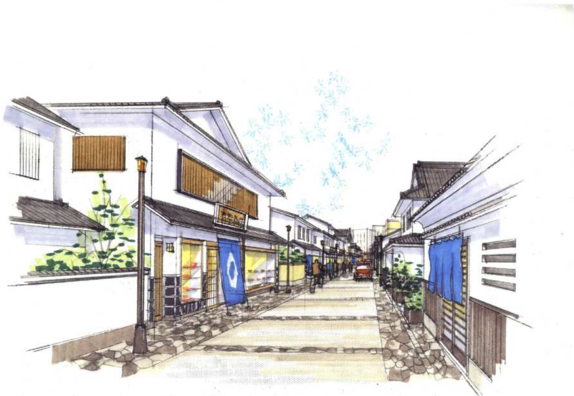
—歴史的まちなみを活かした市街地整備のイメージ—

業務地は、官公庁施設の一定の集積がある田島地区に集約的に配置し、機能の充実に努める。