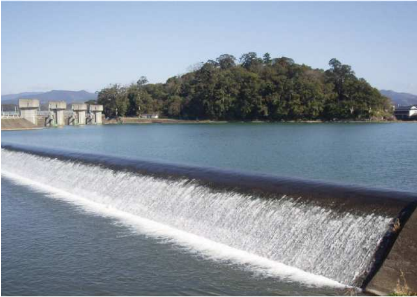
－三隈川と亀山公園－