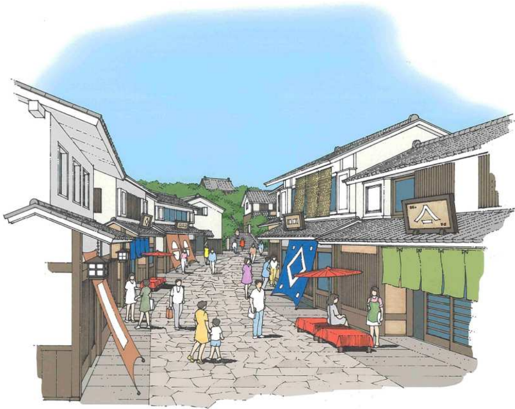
—歴史資源を活かしたまちなみ形成のイメージ—

官公庁施設は、一定の集積がある洲崎地区及び臼杵公園周辺に配置し、機能の維持・充実を図る。