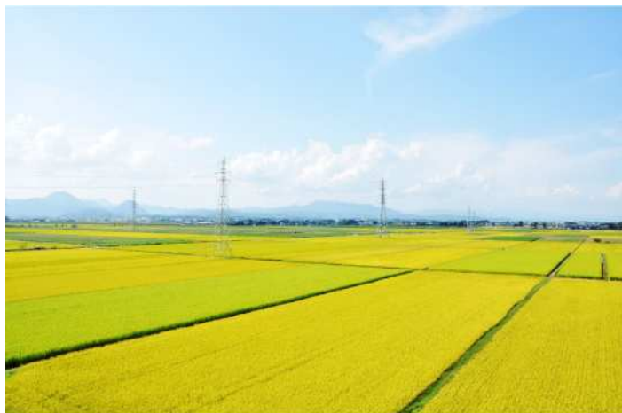
— 田園風景 —