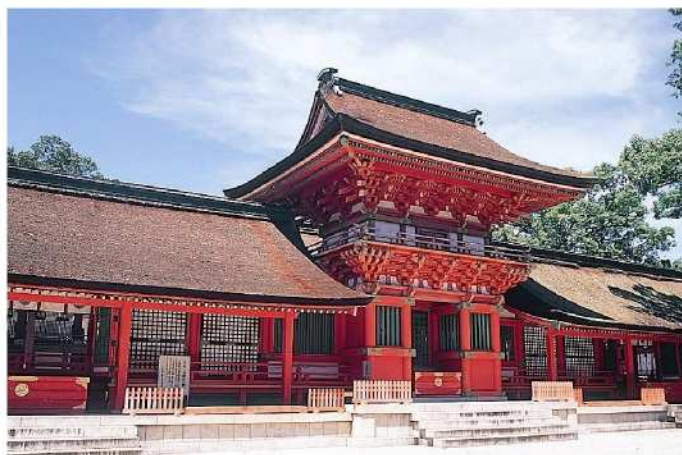
— 宇佐神宮 —