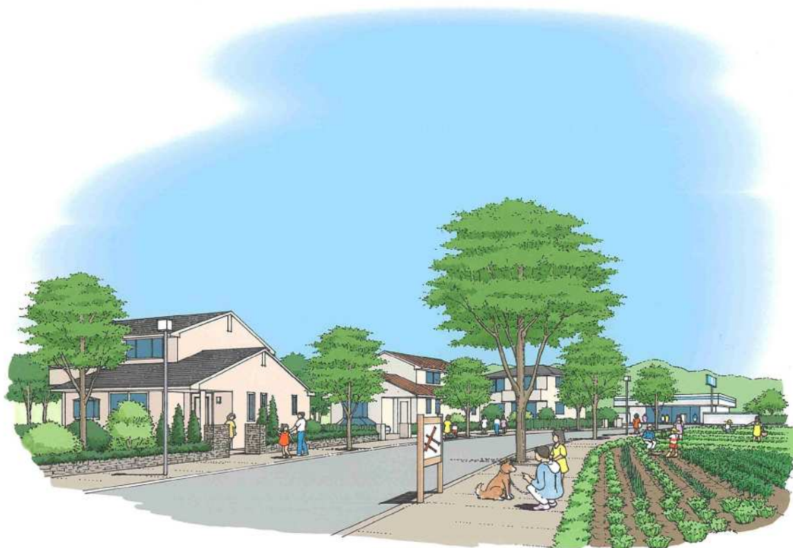
—住宅地（郊外部）の整備のイメージ—

今後とも、無秩序な宅地開発が進まないよう、本都市計画区域の西部から中央部に住宅地を配置し、増加する人口の適切な収容を図る。このうち、中津駅周辺では、中津駅北土地区画整理事業の進捗を促進し、中心市街地の居住環境の向上とまちなか居住の推進を図る。また、郊外部の住宅地については、良好な住環境を守るため地区計画などにより今後ともその環境の維持・改善に努める。