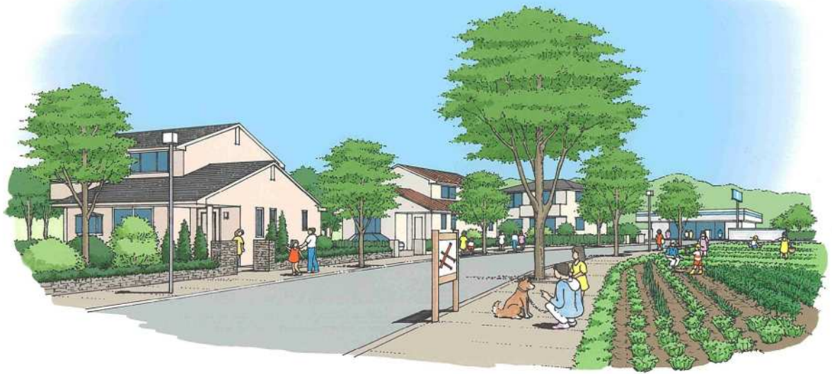
—良好な住宅地の整備イメージ—